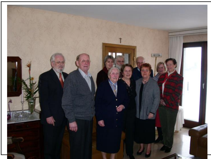
Le Comité en compagnie de notre centenaire.